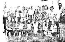
Nagrodzeni uczniowie i opiekunowie

Pozytywny wpływ spółdzielni uczniowskiej na wychowanie dzieci i młodzieży jest w wymiarze społecznym nieoceniony. W praktyce działalność spółdzielni uczniowskich pozwala na kształtowanie ważnych cech charakteru: uczciwości, gospodarności, poczucia odpowiedzialności za słowa i czyny, umiejętności wygospodarowania czasu na sprawy społeczne, oszczędności, staranności, punktualności, zamiłowania do porządku, szacunku do mienia społecznego i prywatnego oraz cech koleżeńskich jakimi są zyczliwość i uczynność, chęć pomagania innym, wspieranie się w trudnościach, odwaga w poszukiwaniu prawdy a także praktyczne przygotowa-