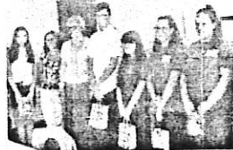
Uczniowie SU „Puchatek” i SU „Piegušek”

W dniu 8 czerwca br. w świetlicy Ośrodka Szkolno-Wychowawczego nr 1w Kielcach, przy ul. Warszawskiej 96 odbyło się uroczyste spotkanie z okazji posumowania działalności spółdzielni uczniowskich województwa świętokrzyskiego za rok 2017. Spotkanie rozpoczęło się uroczystym wręczeniem nagród